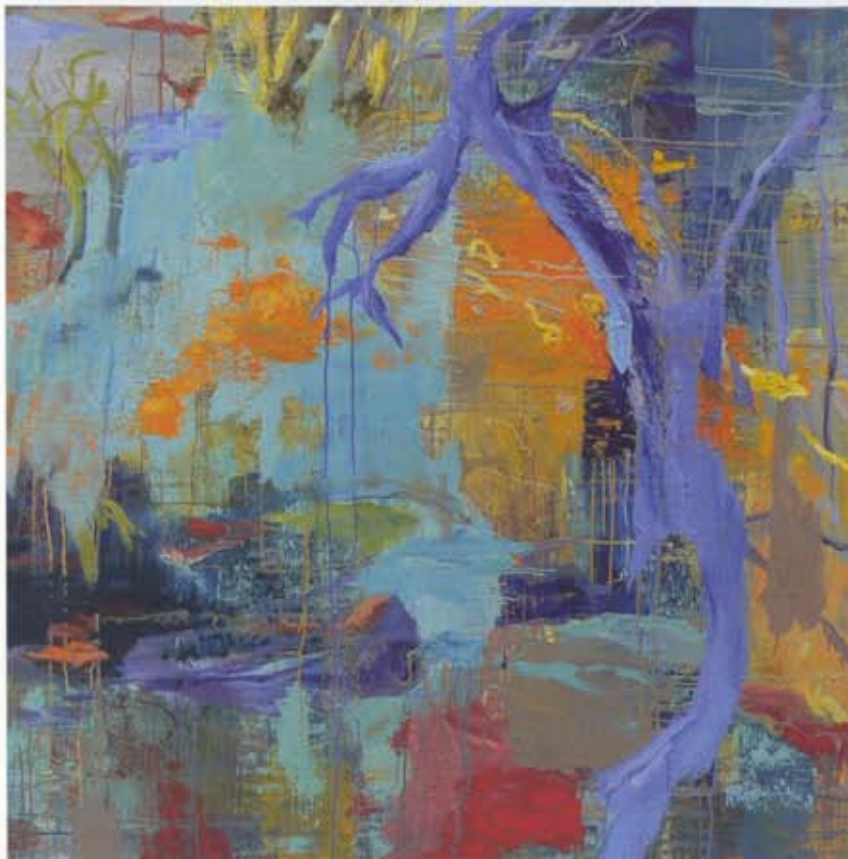
'dbs.07' (2007). olieverf op linnen, 150 x 150 cm.

Muller: 'Ik tart de grenzen van wat ik kan bereiken met een bepaald materiaalgebruik. Na die grens kom je in een onbekend gebied, waar het spannend wordt en er iets nieuws te ontdekken valt. Ik verbied mezelf in herhaling te vallen door steeds een effect op dezelfde manier te gebruiken. Daardoor kun je de grenzen oprekken van je kennis van hoe verf werkt, hoe de kleuren op elkaar reageren. Zodra je voorbij het gekende effect schildert, kom je in het gebied van leegte, van niet-weten.'