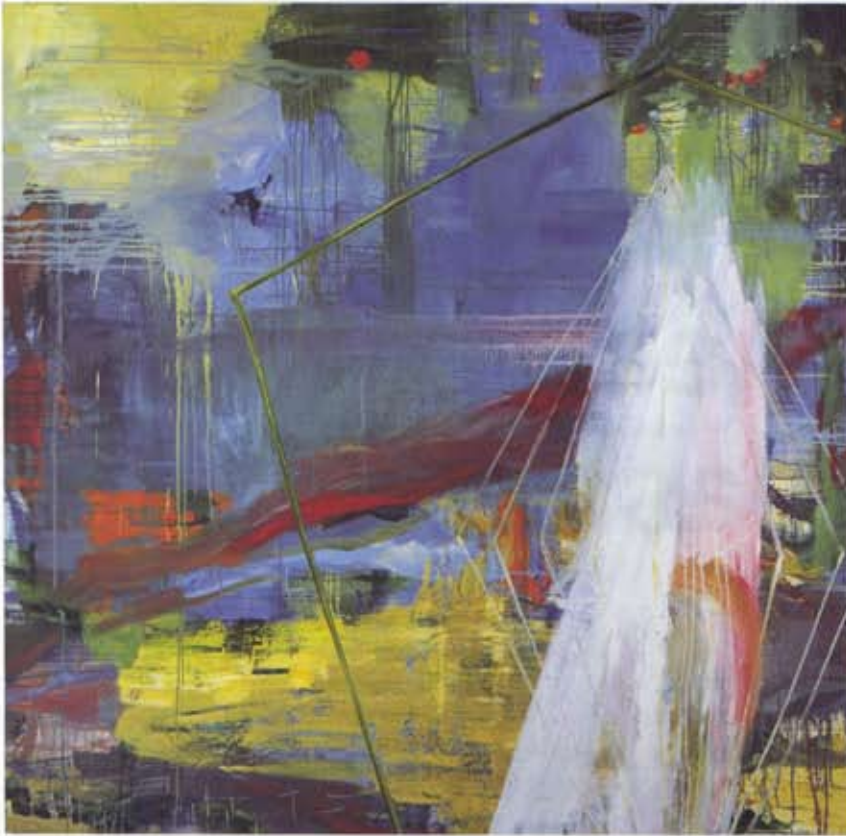
'vfh.07' (2007). olieverf op linnen, 200 x 200 cm.