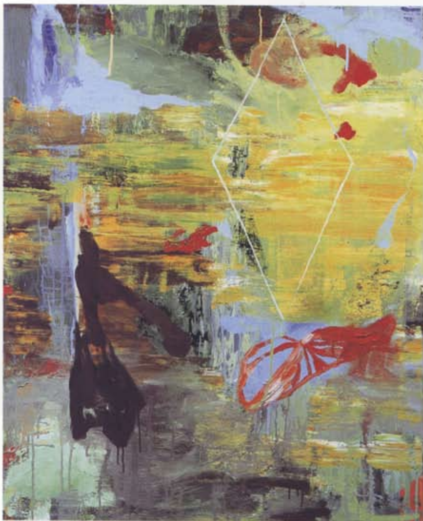
'dmt4.06' (2006), olieverf op linnen, 80 x 100 cm.

'Van tevoren was ik bang', vertelt Muller, 'dat sommige schilderijen, doordat ik zo veel verschillende formaten gebruik, zouden wegvallen tegen de hoge muren van de expositieruimte. Maar het is juist een heel knallende expositie geworden.' Een schilderij met een opvallend front in aquamarijn, met daaromheen onder andere kobalt- en koningsblauw, werd om die reden bewust hoger gehangen dan de rest van het werk. 'Mensen gaan de ruimtelijkheid die het kleurgebruik suggereert, vaak maar al te gemakkelijk invullen. Een blauw vlak voorin wordt dan al gauw een poeltje, vooral als daarin het blauw van een boomstructuur rechts enigszins weerspiegeld wordt. Maar ik ben helemaal niet op zoek naar dat soort ruimtelijkheid', aldus Muller. Een oplossing voor dit probleem vond ze in de situering van het schilderij aan de wand, zeker een meter hoger dan de rest. Daardoor ga je als kijker met een heel ander perspectief naar dit blauw kijken, en wordt je veel meer bewust van de vlakverdeling op zich, zonder daarbij allerlei associaties te maken met bestaande omgevingen.